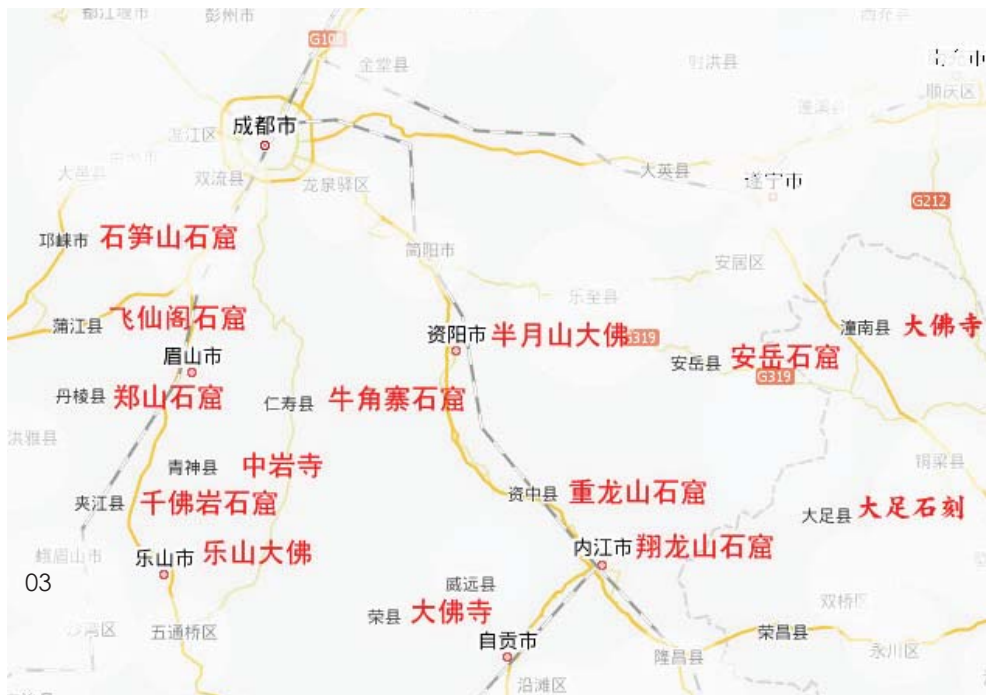
03 成都周边唐代石窟分布图

是我国最早的“西方三圣”。开凿于北齐天保元年至六年（550—555）的河南安阳小南海石窟中窟2米余宽的西壁刻有根据《观无量寿经》十六观的三品九生图。已经使用大量线刻浮雕来表现八功德水、三辈往生等题材。开凿于唐末的大足北山观无量寿经变窟高6米余，开凿于南宋淳熙到淳佑年间（1174—1252）的重庆大足宝顶山大佛湾中段三品九生长达十余米，规模宏大。