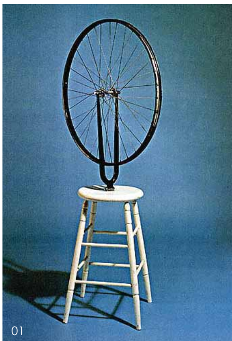
01 杜尚作品 02 德加雕塑作品

现成品最初介入艺术是在绘画领域，而其发生发展则更多地是在雕塑领域，现成品在雕塑作品中的出现可以追溯到早期德加雕塑作品(图02)以及毕加索的一系列雕塑尝试中的拟形作品，比如他利用自行车组件构成的公牛头和以玩具汽车造型代替狒狒头部的雕塑(图03图04)。在这些作品中毕加索一改过去雕塑非雕即塑的制作手段，利用废弃物的组合和铸造技术创造了某种可称之为静物构成的作品。应该注意到这些作品中所采用的类似零件和玩具的物件的存在并不具备自身的说服力，在这里这些物件并不是代表它们自身，而是参与造型，进而达到审美的目的，在这个时期的作品中现成品一旦进入作品就